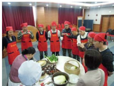
キムチづくりの風景

18日以降は、韓国の各施設及び史跡等を見学し、韓国と北朝鮮との関係や統一問題などを研修し、同時に通貨や物価の違い、円高の状況も体験することもでき、大変有意義なものとなりました。